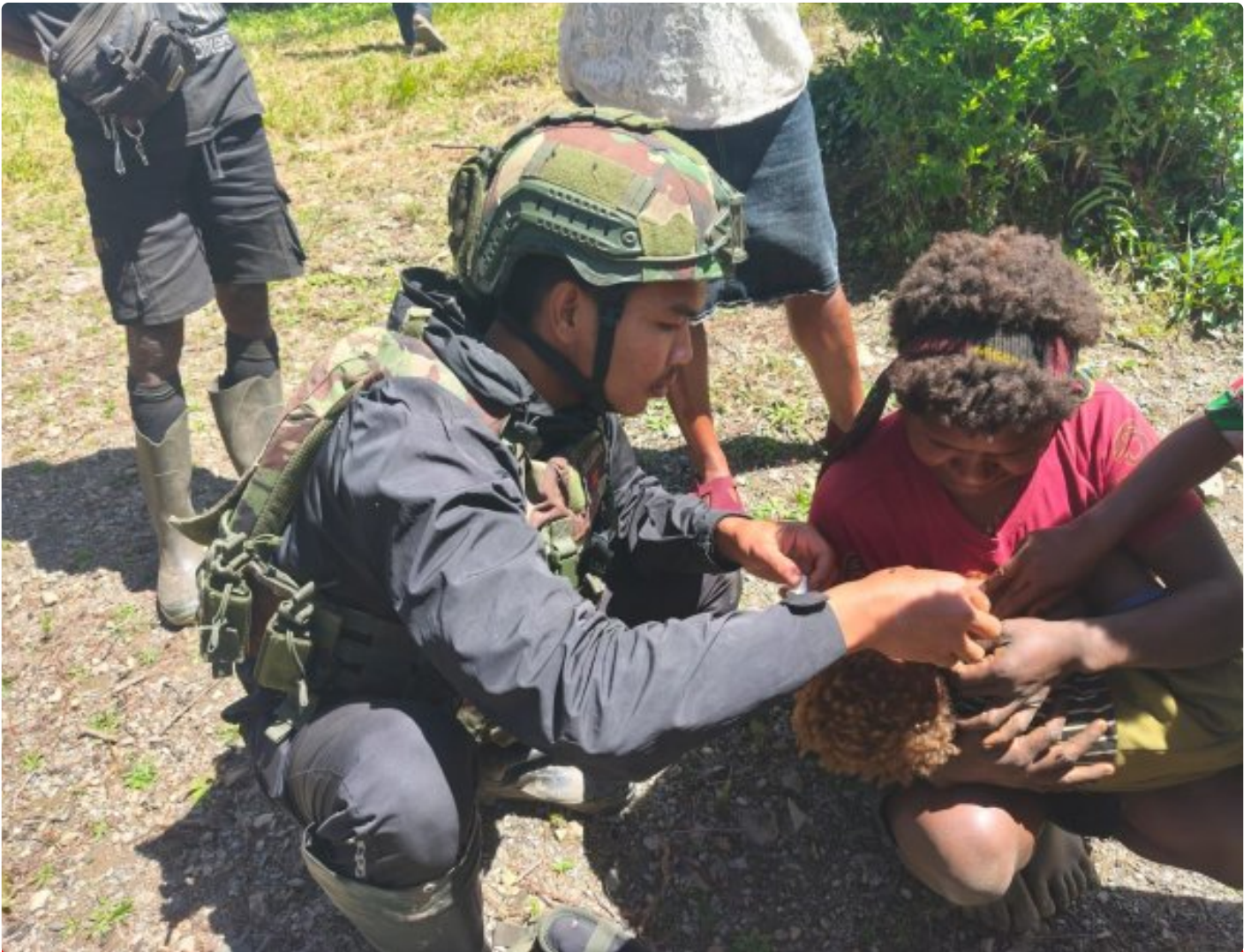
Foto: Prajurit TNI Satgas Pamtas RI-PNG Mobile Yonif 113/Jaya Sakti (JS) Pos Maya menghadirkan pelayanan kesehatan secara door to door di Kampung Ogeapa, Distrik Homeyo, Kabupaten Intan Jaya, Jumat (20/2/2026).

INTAN JAYA- Akses layanan kesehatan yang terbatas di wilayah pedalaman Papua Tengah mendorong Satgas Pamtas RI-PNG Mobile Yonif 113/Jaya Sakti (JS) Pos Maya menghadirkan pelayanan kesehatan secara door to door di Kampung Ogeapa, Distrik Homeyo, Kabupaten Intan Jaya, Jumat (20/2/2026).