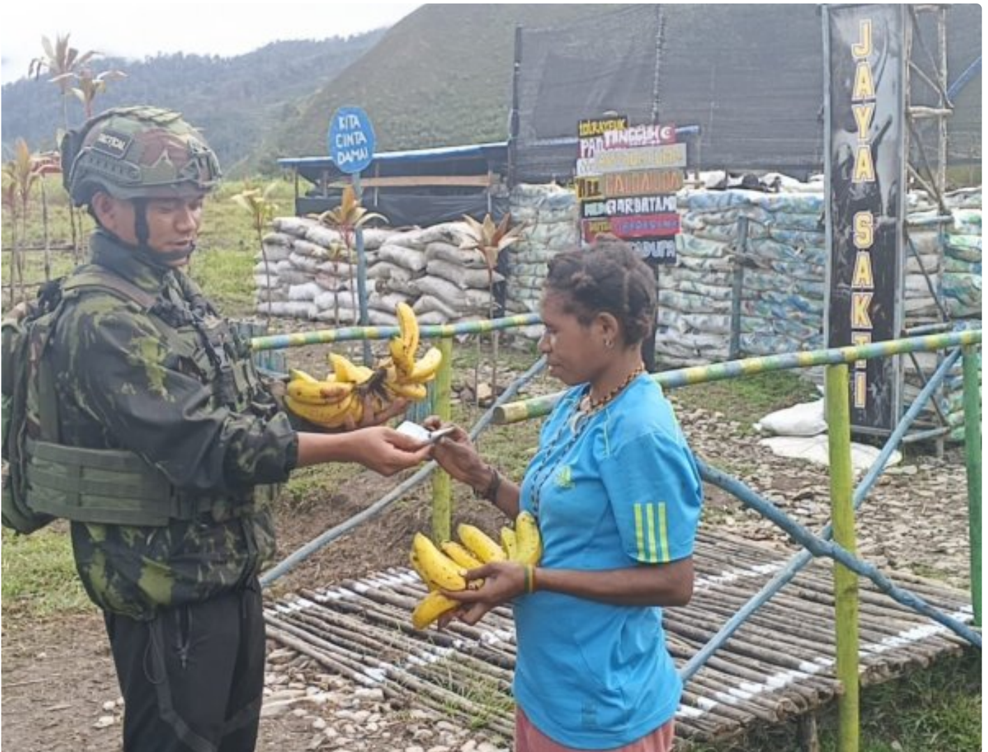
Foto: Prajurit Satgas Pamantas RI-PNG Mobile Yonif 113/Jaya Sakti (JS) Pos Bilai kembali menggelar program Borong Hasil Tani (Bohati) di Kampung Engganengga, Distrik Homeyo, Kabupaten Intan Jaya, Papua Tengah, Jumat (20/2/2026).

INTAN JAYA- Satgas Pamantas RI-PNG Mobile Yonif 113/Jaya Sakti (JS) Pos Bilai kembali menggelar program Borong Hasil Tani (Bohati) sebagai upaya mendukung perekonomian masyarakat pedalaman di Kampung Engganengga,